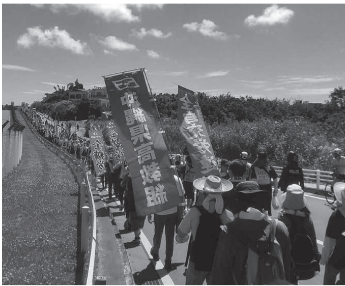
どこまでも続く、広大な米軍基地のフェンス