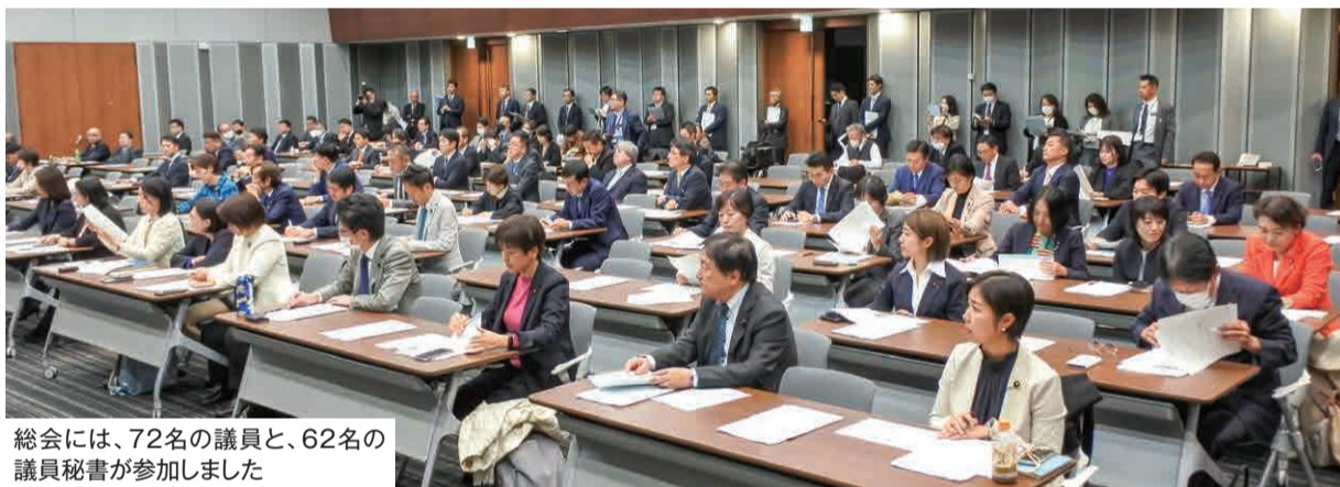
総会には、72名の議員と、62名の議員秘書が参加しました