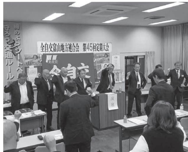
「新法阻止参院選勝利に向けガンバロー」と三唱

全自交富山地連は11月12日、富山交通内会議室に於いて23名が出席し、第45回定期大会を開催しました。