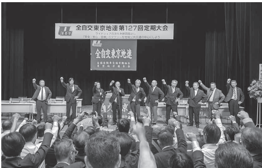
「ライドシェア新法絶対阻止」を誓い拳を振り上げた東京地連の仲間

全自交東京地連は10月29日、新宿区の四谷区民ホールで第127回定期大会を開き、ライドシェア新法断固阻止を柱とする新年度運動方針や予算を確立しました。