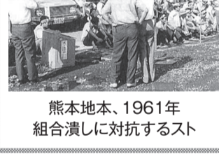
熊本地本、1961年組合潰しに対抗するスト