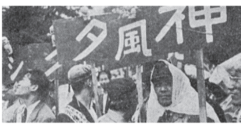
1950年代後半、暴走する「神風タクシー」が社会問題化。原因である過酷な営業ノルマの撤回を求めて闘いました。