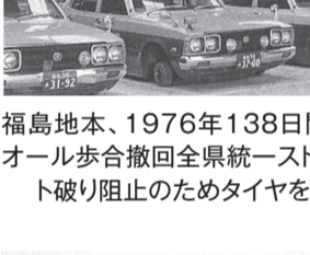
福島地本、1976年138日間にわたるオール歩合撤回全県統一ストを決行。スト破り阻止のためタイヤを外した。