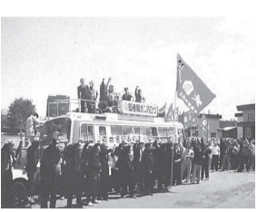
北海道地連、1985年不当解雇撤回闘争