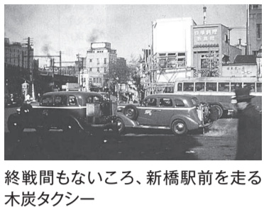
終戦間もないころ、新橋駅前を走る木炭タクシー

1974年の現在の自交総連との大分裂、また2011年の分裂と歴史的再統合など、その道は決して平坦なものではありませんでした。しかし、私たちはこの先も未来の仲間に向けて、全自交運動のバトンをつないでいかななくてはなりません。