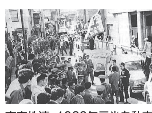
東京地連、1962年三光自動車労組の委員長が暴力団に刺殺され、怒りの糾弾集会