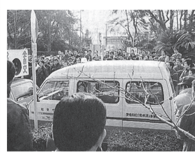
1985年、愛媛地本の組合員は「軽貨物タクシー」の出発式で、車両を取り囲み、実力で運行開始を阻止しました。

白タク阻止は全自交運動の長年の柱の一つです。荷主同乗で旅客を輸送しようとした「軽貨物タクシー」や、悪質な運転代行の白タク阻止闘争を展開し、現在はライドシェアと闘い続けています。