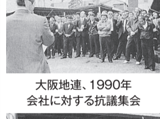
大阪地連、1990年会社に対する抗議集会