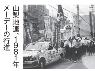
山梨地連、1981年メーデーの行進