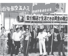
青森地連、1988年組織拡大キャラバン