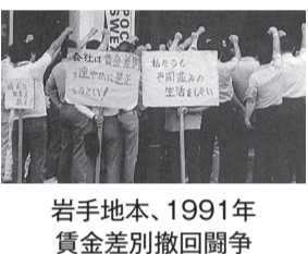
岩手地本、1991年賃金差別撤回闘争