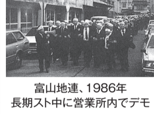
富山地連、1986年長期スト中に営業所内でデモ