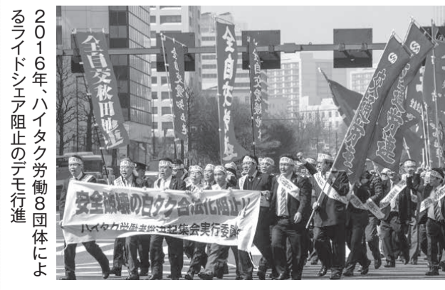
2016年、ハイタク労働8団体によるライドシェア阻止のデモ行進