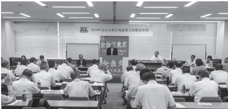
各単組の教宣担当者ら74人が参加