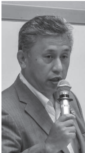
争議中の仲間へ「必ず道は 開ける」と語る溝上委員長

「政府としてはタクシードラ イバーの労働環境等に与える 影響に留意することが重要で あると考えている」との答弁 も引き出しました。