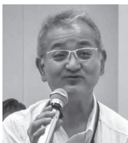
野尻書記長は物価高の状況に触れ「外国人をうらやまし」と見ているのではなく、日本人、そしてハイタク乗務員の賃金が物価高に対応できるように最賃は上げるべきだ」と述べました。